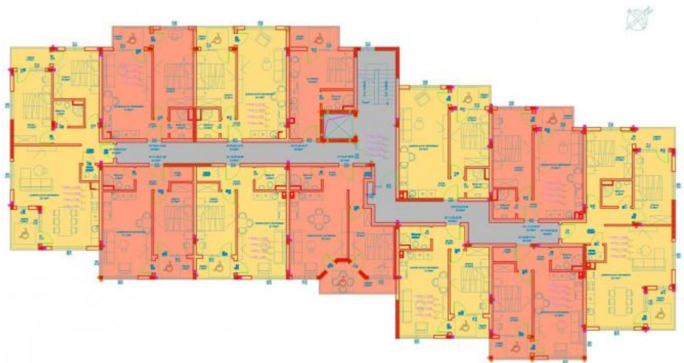
РАЗПРЕДЕЛЕНИЕ +3.45, +6.30,+9.15,+11.75